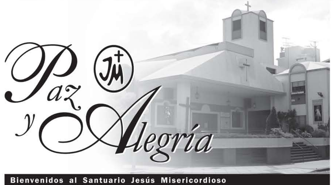
Bienvenidos al Santuario Jesús Misericordioso

Para recibir mensualmente por e-mail noticias del Santuario, solicítelo a: santuario@jesus-misericordioso.org Para peticiones y agradecimientos, enviar email a: peticiones-agradecimientos@jesus-misericordioso.org Boletín informativo y gratuito del Primer Santuario de Jesús Misericordioso en la República Argentina. P.I. Rivera 4591 (C1431BVA) Bs. As. Argentina. Tel: (011) 4522 - 3427 / 4521 - 3153 Web: www.jesus-misericordioso.org R.P.I.: 238.729/91